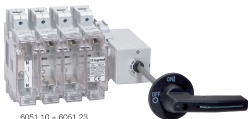
6051 10 + 6051 23