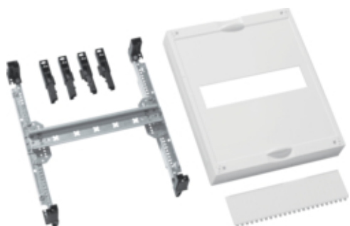
univers N Blok do MCCB 160A