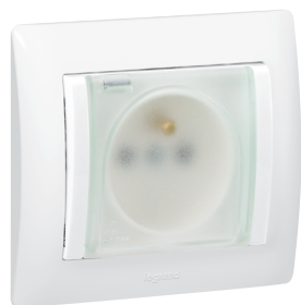
7759 29 + 7710 01

Mechanizmy wyposażone w metalowy uchwyt. Możliwy montaż w puszcze przy użyciu pazurków lub wkrętów.