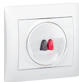
7757 85 + 7710 00 + 7710 01

Mechanizmy wyposażone w metalowy uchwyt. Możliwy montaż w puszcze przy użyciu pazurków lub wkrętów.