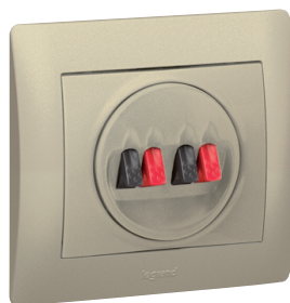
7757 84 + 7714 25 + 7714 01