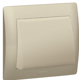
7759 85 + 7714 85 + 7714 01

wyjście kablowe, zaślepki, akcesoria do klawiszy, mechanizmy IP44, akcesoria IP44