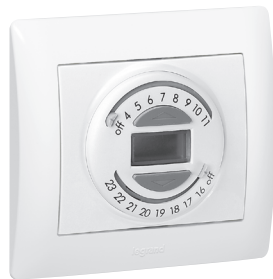
7757 46 + 7770 19 + 7710 01