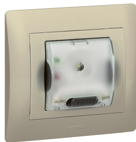
7759 41 + 7714 41 + 7714 01

Mechanizmy wyposażone w metalowy uchwyt. Możliwy montaż w puszcze przy użyciu pazurków lub wkrętów.