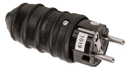
Wtyczka gumowa przenośna Rubber cover plug