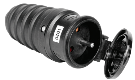
Gniazdo gumowe przenośne Rubber cover socket