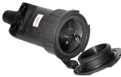
Gniazdo gumowe przenośne IP65 Rubber cover socket

Uwagi / remarks: D.3157L - Standard Francuski / French, D.3157SL - Standard SCHUKO