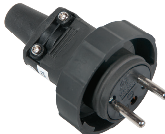
Wtyczka gumowa przenośna IP65 Rubber cover plug