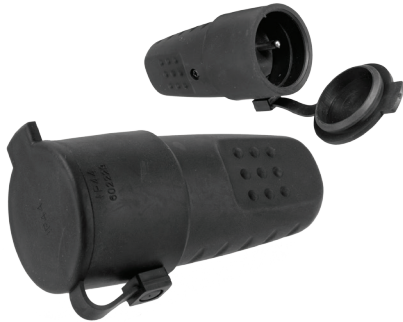
Gniazdo gumowe przenośne Rubber cover socket

Connecting equipment - rubber cover socket