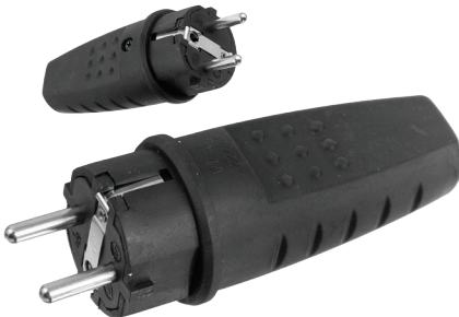
Wtyczka gumowa przenośna Rubber cover plug