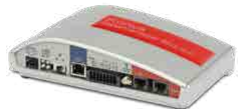
/ Fronius Datamanager Box 2.0