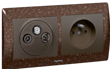
7757 89 + 7712 73 + 7759 28 + 7712 28 + 7717 02