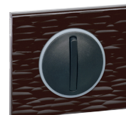
0670 01 Corian czarny dłutowany z pierścieniem 0676 70 + 0652 03