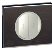
2 X 0670 01 Nikiel czarny z podświetleniem 2 x 0676 86