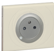
0671 11 Skóra perła z lampką led 0676 64