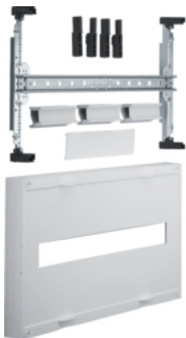
univers N Blok do MCCB 160A