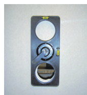
Wywierć kolejny otwór.