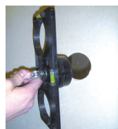
Wywierć otwór centralny